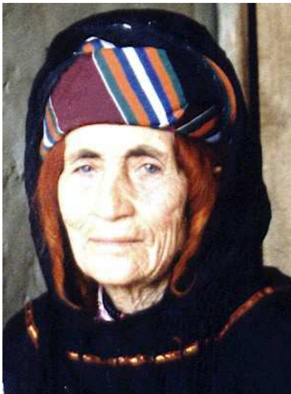
Saadê Tertelê 38i SENGAL XANIME 6