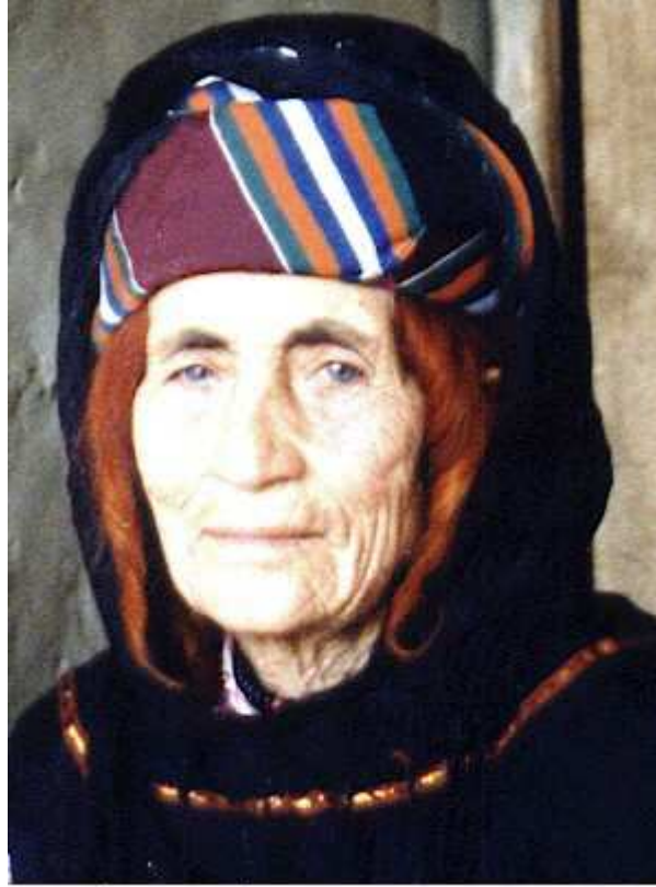
Saadê Tertelê 38i SENGAL XANIME 6