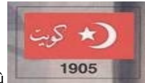
ya bo Kuweytê pêşniyazkirî bû