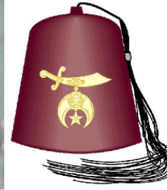
Nasdartirîn nîşana Masonî