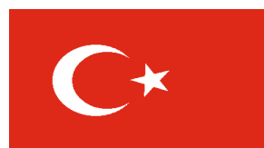
Ala ya Turkan a niha

Bo çî heyva ku nîşan û durîşmeke salname ya îslamî ye, wilo hatiye teqlekirin, an bervajîkirin û sernexûn û devberjêrkirin? Wekî li ser Qalpağa “Kalpaka !” mezinên Turkan di dema roxandina dewleta Osmanî de..