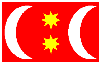
Ala Saziya Suwarên Malta

Hîn di dema Osmaniyan de, mestirîn civata Masonî ya rojhilatî li Beyrûtê bû, û hîngê Lubnan di bin destê Osmaniyan de bû. Navê wê civatê “Alhîlal” bû, ku bi Kurdî “Heyv”e. Hinek zana û roşenbîr ên wê civatê, yek ji wan jî nivîskar û çêrokbêjê navdar Curcî Zêdan bû, ku bi xwe Fileh bû, hema bêtirê karê wî li ser dêmguhartinê dîrok û kesaniyên îslamî bû, kanî bû yek ji navdartirîn kovarên bi Erebbî bida weşandin û belavkirin, ku ta niha hikariya wê di çêrokbêjî û dîroknasiya Ereban de mayî. Heyva wî jî wekî ya Masoniyan û wekî ya ala Turkan ber bi Çep bû.