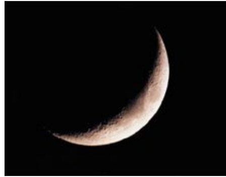
Li seriyê mehê wekî “R- ر” a Erebi

Gava em baş li van wêneyan binêrin, emê bibîn kudi destpêka mehê de aliyê rastê yê heyva taze derketî bi rohnî ye, aliyê çepê di tariyê de ye, û li dawiya mehê tersî wê rewşê ye, aliyê çepê bi ronahiye û aliyê rastê di tariyê de. Serê meha koçî wilo dixuye, ku kevana heyvê bi aliyê çepê de ye û li dawiya mehê bi aliyê rastê de ye... Li ba Ereban heyv a taze wekî tîpa wan “R - ر” e... Gava em li nexşên îslamî yên Kevin binêrin, an li ser dîwarên mizgeftên wan, li derve û li hinder, an jî li ser xalî û sicadeyên Musilmanan, emê heyva îslamî, ya seriyê meha Koçî bibînin, ne ya ku tersî wê ye, û wekî tîpa “C” tê xuyakirin.