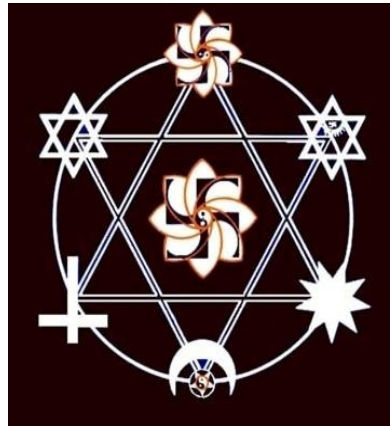
Li ba Masoniyê