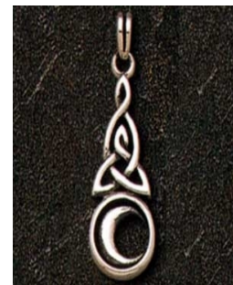
Yek ji zincîrkên navdar