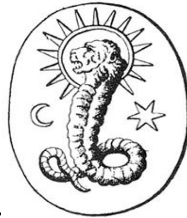
Li ba olên kevnare

Tevgera Masonî, ku armanca wê cîhanî ye, bo xwe gelek nîşanan bi kar tên, ji wan jî: mûmdan, agirdan, ro, heyva ber bi Çep, xaç, stêrka şeşperkî û tîpa (J), ku bi Almanî (Y) tê xwendin û kurtepeyva “Yehûd” ye... Xaç li xarê wekî xwe maye, û ne dûre bo xapandina Filehan wilo maye... Di van wêneyên din de hinek di hatîne diyarkirin, ji wan jî nîşana “Gur”, ku Turk bi destê xwe û bi du tiliyan pêda dikin. Mixabin, partiyekî ramiyarî ji partiyên me yê rojavayê Kurdistanê yek ji van sîmbolan, hespê bi du basikan, ku Kurd jêre “Duldul” dibêjin, ji xwe re wekî sîmbol bi kar aniyê, û dibe jî ewên ew hesp hîlbijartine, tew nizanin ku ew yek ji sîmbolên wan desteyên veşartî